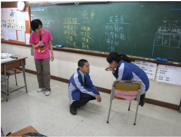
中文科採用「角色扮演」策略教授換位思考的技巧

第四階段完成後，本會對參與教師進行了訪談和問卷調查。結果顯示，教師均十分認可該階段進行的教學設計和課堂施教時進行的改變，認為其與平日普通的教學課堂有著較大的改進，學生更為投入課堂學習，學習成效明顯提高。教師分別在問卷中表示「運用不同的創意教學策略能夠提高課堂教學效能」、「不同的創意教學策略可締造不同的學習經驗，讓學生有所經歷，透過思考去學習，從而提升其對該課題的理解、思考