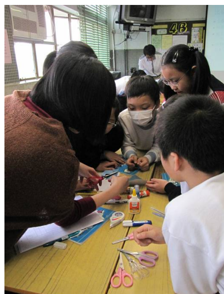
數學科採用「遊戲演繹」策略，幫助學生合作學習

18 組進行試教。各校教師根據教學內容和教學目標，選擇不同的創意教學策略進行教學設計。經過創意培訓後，大部份老師均樂於改變固有的教學方式，採用平日較少接觸的策略重新設計教學流程，在通過對比不同班級的教學成效，觀察這些教學策略的實際功效，以及使用時所須注意的事項。