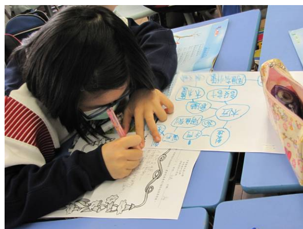
學生藉助「腦圖」和「類推比喻」策略，進行新詩創作