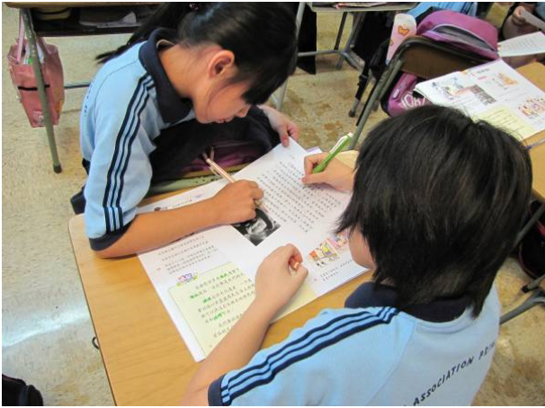
學生使用「提綱摘要」策略，提取文段重要信息